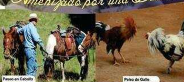
Paseo en Caballo